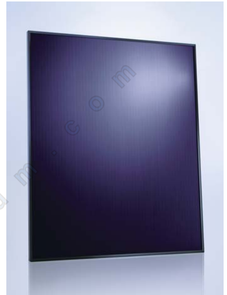
SCHOTT ASI® 90/95